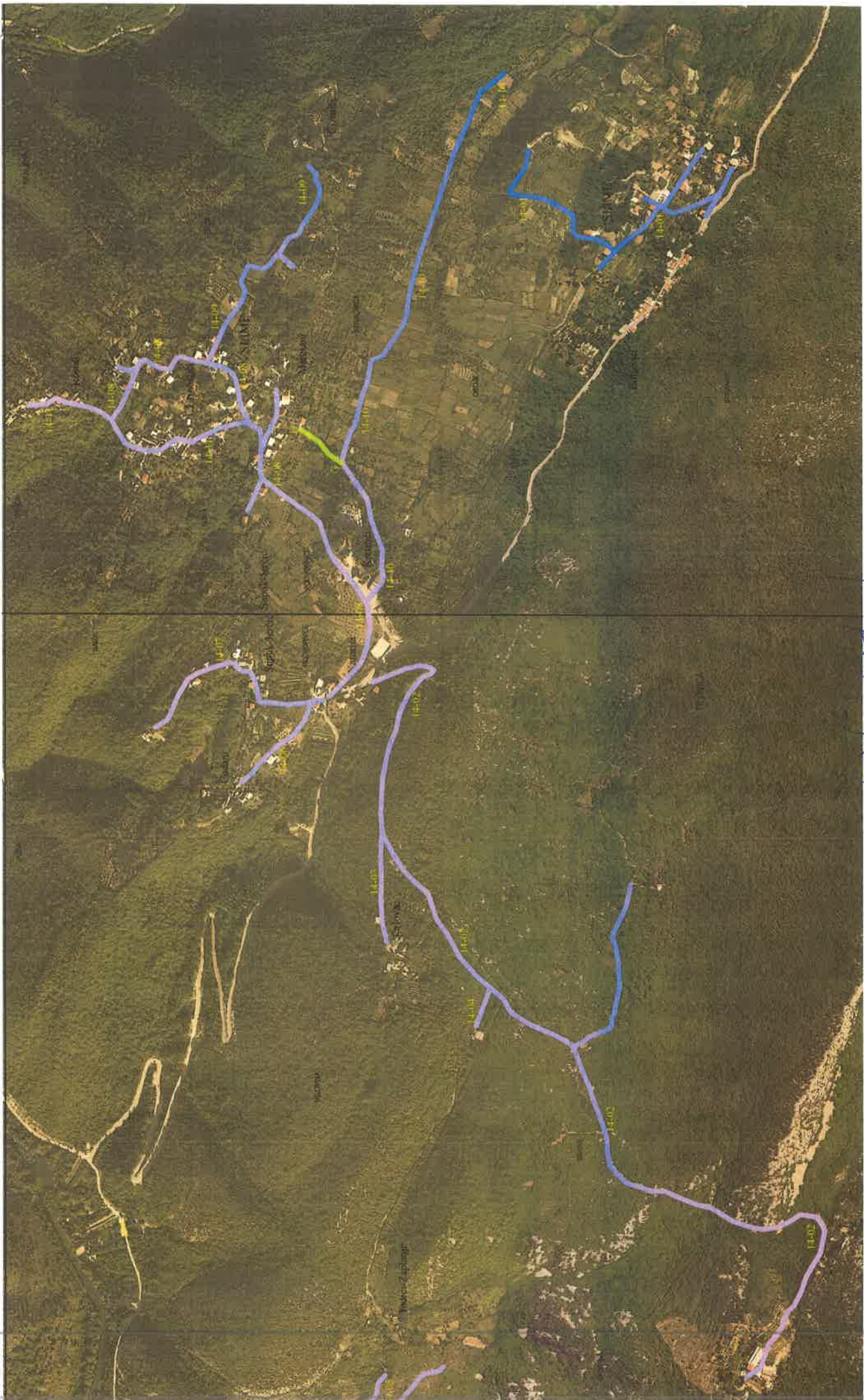
REKAMEN GRAFISIK ALIRAN 4