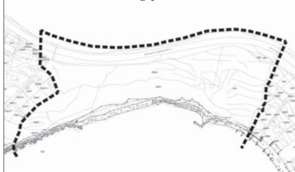
Obuhvat Urbanističkog plana

Kopneno područje koje je predmet izrade Urbanističkog plana određeno je trasom državne ceste D8, koja mora biti uključena u obuhvat Urbanističkog plana, do obalne crte. Urbanistički plan će obuhvatiti i odgovarajuću površinu akvatorija radi planiranja sportske luke. Površina obuhvata Urbanističkog plana, kopneno iznosi oko 3,5 ha, prema podacima iz katastarske podloge u mjerilu 1:5000. Obuhvat akvatorija orijentacijski će biti 100 m od obalne crte