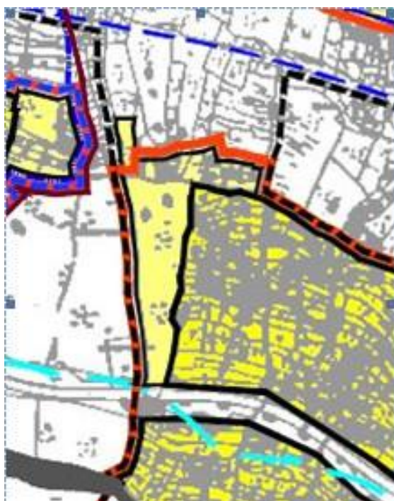
Prostorni plan uređenja Grada Omiša