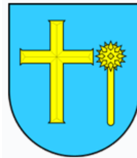
Udio primarne selekcije - Peovica d.o.o.

Po logici „bolje ikad nego nikad“, u Peovici smo, uz suglasnost i (silom prilika – tanku) proračunsku podršku naših suvlasnika - JLS, krenuli u izgradnju sustava. Realizirali smo 3 projekta (povećanje kapaciteta postojećih spremnika – Travanj 2014, postavljanje 31 zelenog otoka – Srpanj 2014, edukativna kampanja – Prosinac 2014) ukupne vrijednosti 403,000 kn, uz bespovratno sufinanciranje FZOEU u iznosu od 133,000 kn, čime su, skromno i na mala vrata, grad Omiš, te općine Dugi Rat, Šestanovac i Zadvarje ušle u krug onih JLS koje su uvele primarnu selekciju otpada. Pregled početnih rezultata: