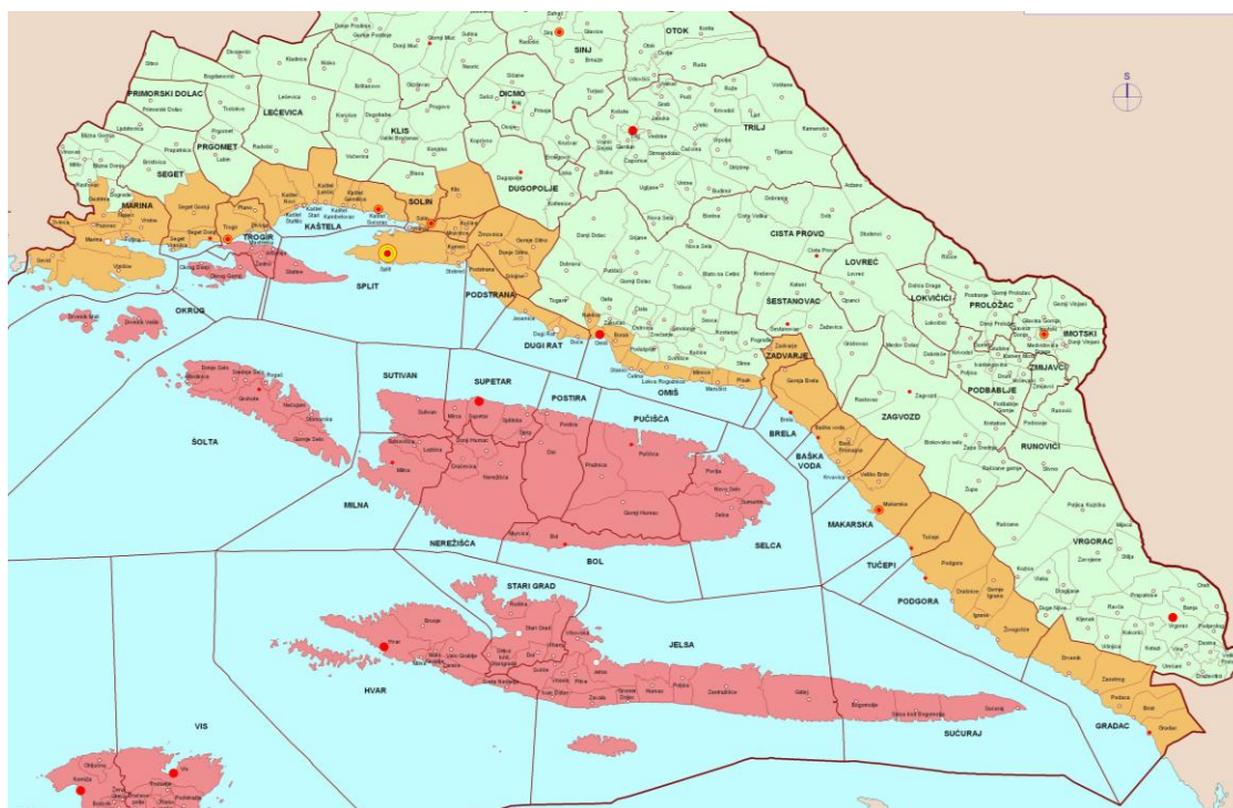
Slika 1. Položaj Grada Omiša u Splitsko-dalmatinskoj županiji

U sastavu Grada Omiša su naselja Blato na Cetini, Borak, Čelina, Čišla, Donji Dolac, Dubrava, Gata, Gornji Dolac, Kostanje, Kučiće, Lokva Rogoznica, Marušići, Mimice, Naklice, Nova Sela, Omiš, Ostrvica, Pisak, Podašpilje, Podgrađe, Putišići, Seoca, Slime, Smolonje, Srijane, Stanići, Svinišće, Trnbusi, Tugare, Zakućac, Zvečanje.